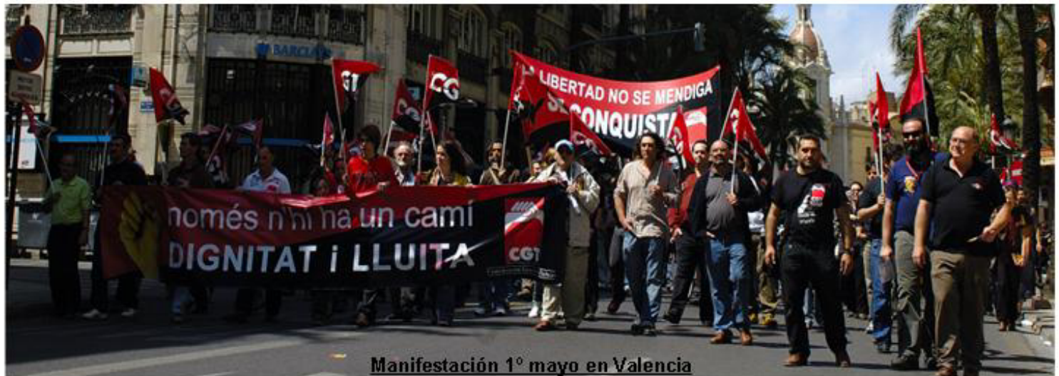
Manifestación 1º mayo en Valencia

Entre los días 8 y 16 de octubre de 1906 se celebró en la ciudad francesa de Amiens el XV Congreso Nacional de la Confédération Générale du Travail. La CGT francesa era una organización sindical fundada en Limoges en septiembre de 1895, en la que ejercían una destacada influencia los anarquistas, entre los que destacaba Fernand Pelloutier, inspirador en 1892 de las Bourses du Travail. Esa orientación se puso de manifiesto en 1906, cuando el citado congreso aprobó una resolución, conocida popularmente como Charte d'Amiens, que sentaba los principios del sindicalismo revolucionario de inspiración anarquista: el anarcosindicalismo. Animadas por estos mismos principios, en diciembre de 1922, organizaciones sindicales europeas y americanas reconstruyeron en Berlín la Asociación Internacional de Trabajadores (AIT), continuadora de la Primera Internacional bakuninista.