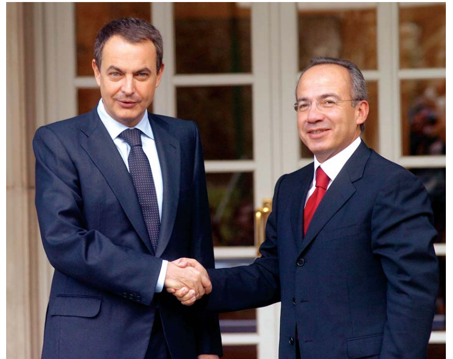
José Luis Rodríguez Zapatero, presidente del gobierno español, y Felipe Calderón Hinojosa, presidente de México, coinciden abiertamente en las políticas neoliberales.