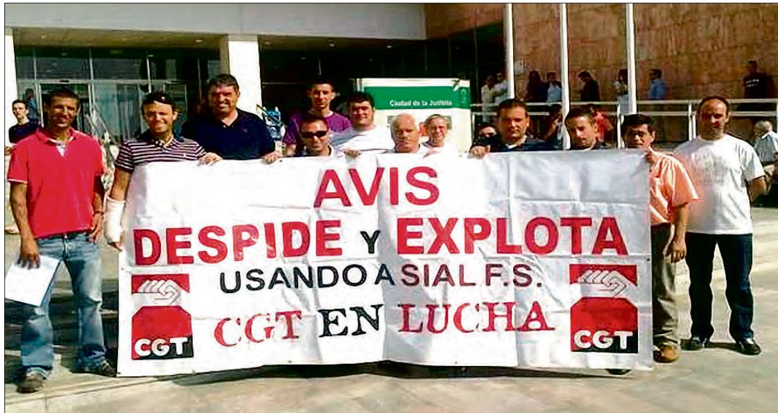
Un momento de una concentración ante la Ciudad de la Justicia de Málaga

MÁLAGA ► Se han celebrado concentraciones en el Aeropuerto y ante la Ciudad de la Justicia