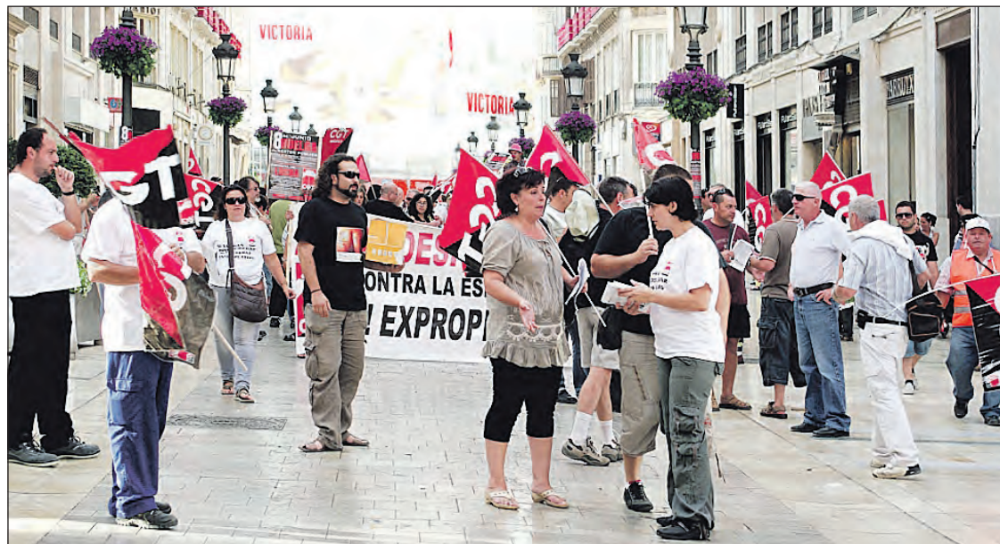
Un momento del pasacalles organizado por la CGT malagueña en calle Larios el pasado día 8 de junio por la tarde