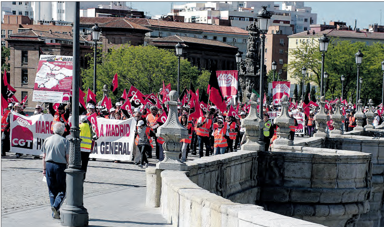
La columna de CGT Andalucía a su paso por el Puente de Toledo en la manifestación del 16 de mayo en Madrid