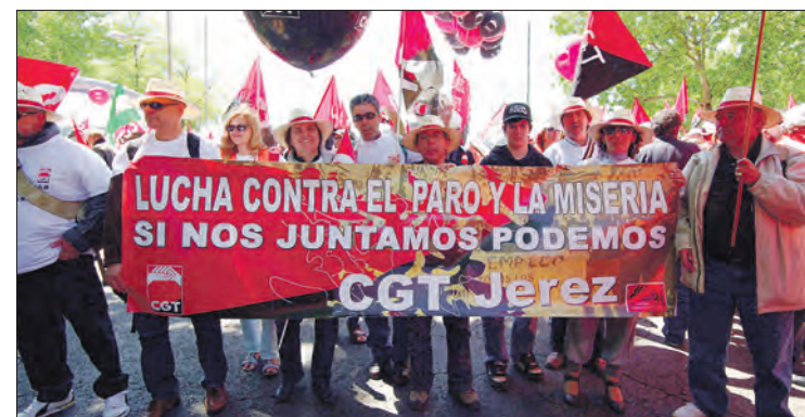
Pancarta del Sindicato Único de Jerez en la Marcha a Madrid.

La Plataforma de Parados lleva tiempo organizando acciones de lucha contra la crisis y ante la salida que le están dando las administraciones, las cuales consideran “contrarias a los intereses de los trabajadores y