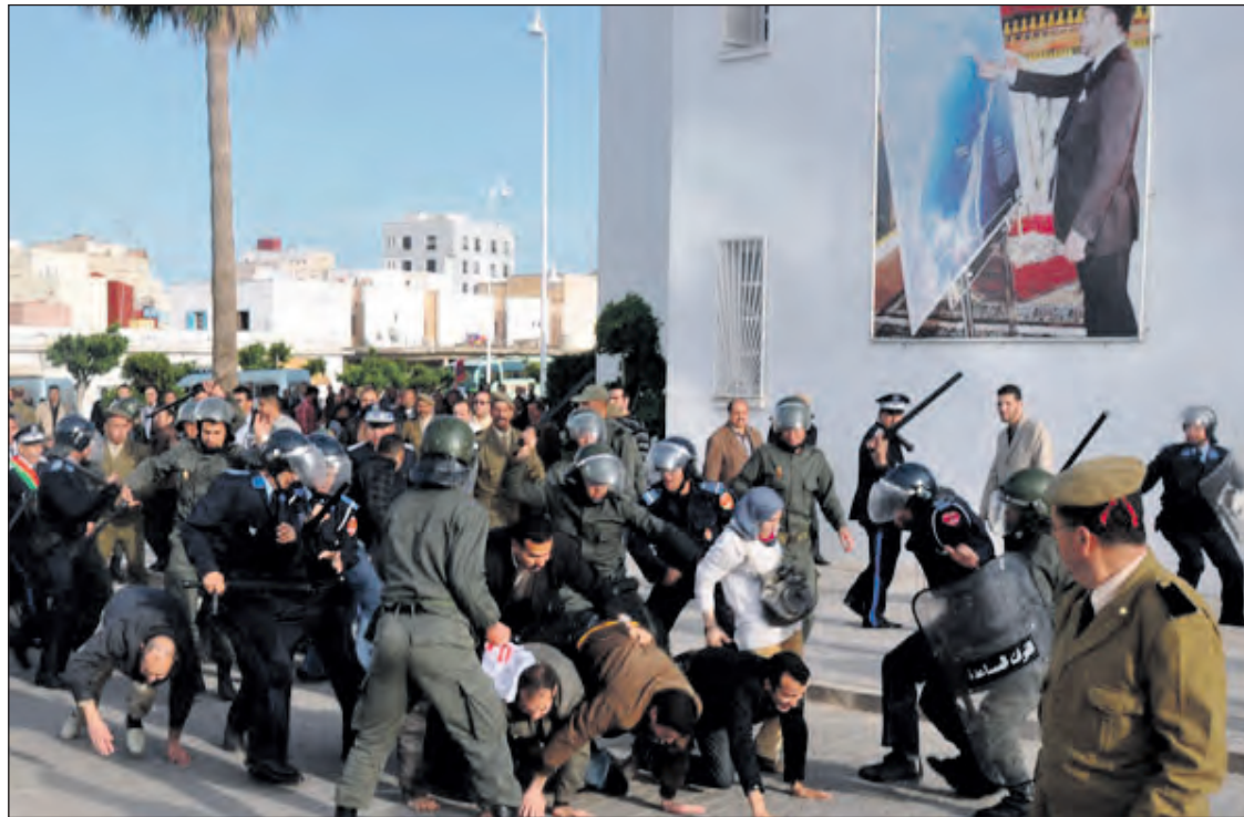
Represión contra los diplomados en paro

La continua rebelión en la zona Oriental (Figuig, Bouarfa, Talsint, Beni Tadjit, Bouanane, Missouri...), parte del Marruecos de la pobreza, de la marginación y de la exclusión, está cuestionando la palabrera del estado. Y las respuestas populares son importantes: la población de Bouarfa se niega desde 2006 a pagar las tasas del agua; la coordinación de la ANDCM de la provincia de Figuig acampa frente a la frontera argelina, en denuncia de un estado marroquí, que les rechaza; la tribu de los Ahl Igli de Missouri, ante el robo de sus tierras colectivas, anuncia la devolución de los carnés de identidad y el abandono de la región; la población de Talsint salió a