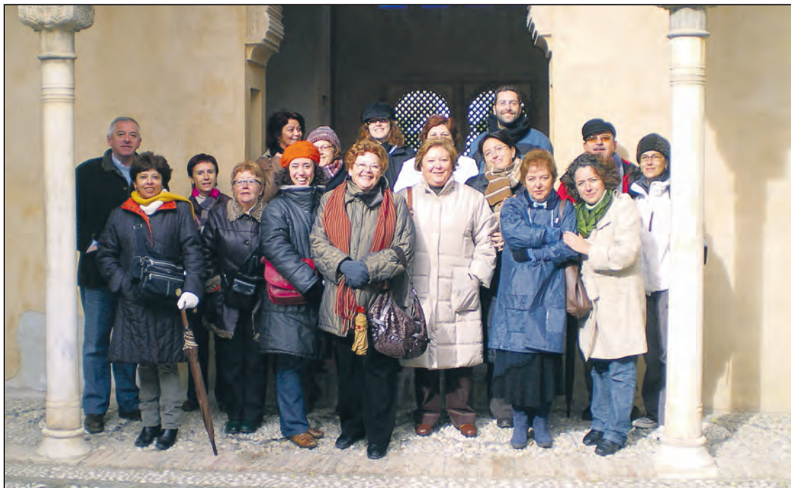
Visita guiada al palacio de Dalahorra de Granada.

“Esperamos y deseamos que se produzca una revitalización de los Ateneos Libertarios”