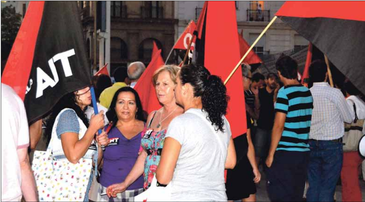
Imagen de la manifestación conjunta en Sevilla