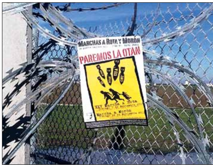
Cartel de la convocatoria de las marchas pacifistas

Sin contar con el Parlamento, despreciando las exigencias de Paz de la ciudadanía española, incumpliendo lo que en el referéndum OTAN se decía respecto a la reducción progresiva de efectivos norteamericanos en nuestro país, al margen de cualquier enfoque de Paz, Desarme y Cooperación Internacional..., el PSOE se va