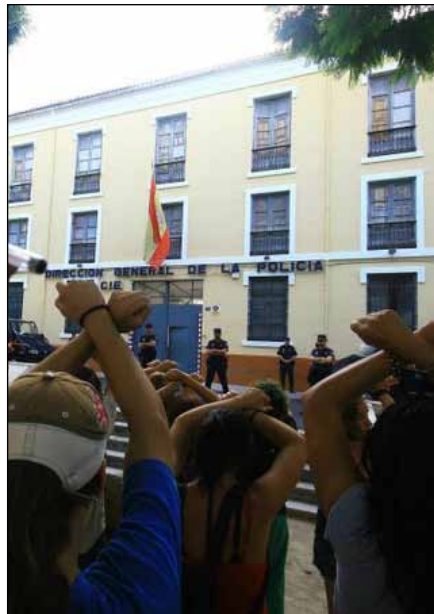
Concentración del 15M en Capuchinos

den de expulsión de Bouziane, a quien amenazaba en Argelia un grave riesgo para su integridad, para su vida.