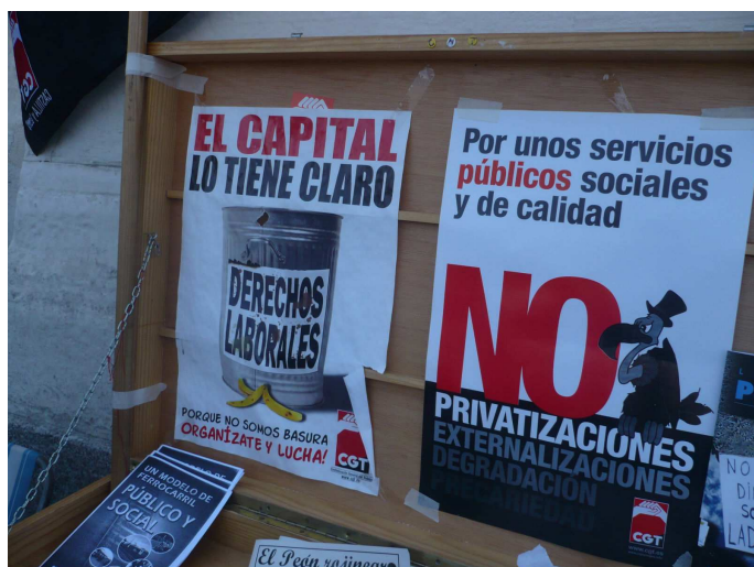
Las imágenes corresponden a la concentración de apoyo ala huelga convocada el pasado 22 de Septiembre

Los motivos son lo suficiente graves como para dar una respuesta contundente. Huelga el 28 de octubre.