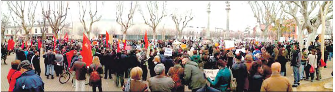
Sevilla: 6.000 personas salen a la calle por el derecho a la vivienda.

● Movilización contra el genocidio financiero, señalamos a los responsables y exigimos STOP desahucios, dación en pago retroactiva y alquiler social ¡YA!