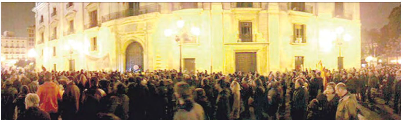
Valencia: Contra los desahucios.