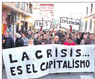
Alicante sale masivamente a la calle.