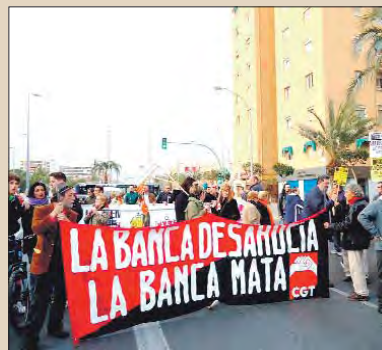
5.000 personas se manifestaron en Alicante.

En un ambiente reivindicativo y combativo unas 5.000 personas recorrieron el centro de Alicante. Durante todo el recorrido se corearon consignas como "hay solución, banqueros a prisión", "obrero desahuciado, banquero ahorcado", que expresaban la rabia e indignación de la ciudadanía contra el saqueo que se está llevando a cabo a todos/as trabajadores/as con la excusa de la crisis, por parte de la clase política y las élites financieras.