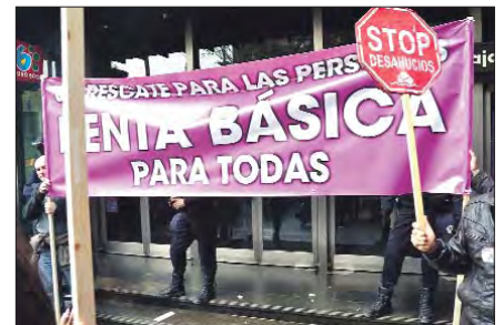
Zaragoza reclama la Renta Básica.