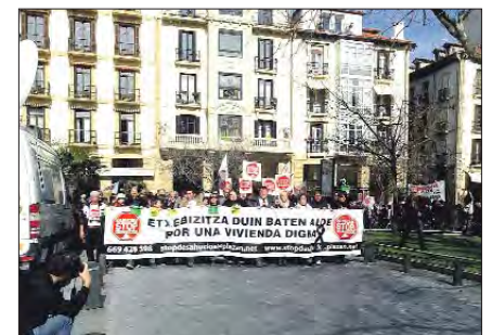
Manifestación en Donosti.