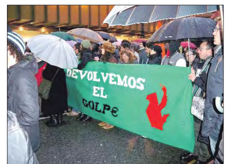
Varios miles de personas se manifiestan en Oviedo.