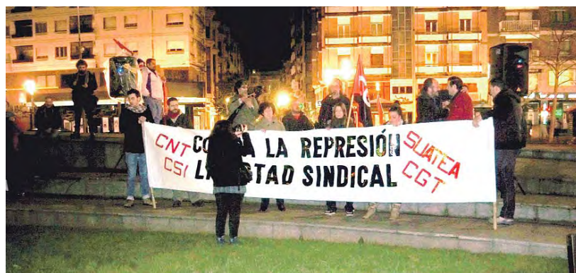
Manifestación celebrada en Gijón con el lema "Basta ya. Contra la represión sindical".CGT-ASTURIAS

Sección Sindical de CGT en Saint-Gobain Cristalería