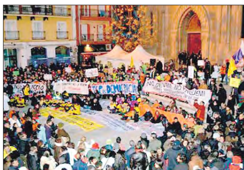
Marea Ciudadana en Lleida.