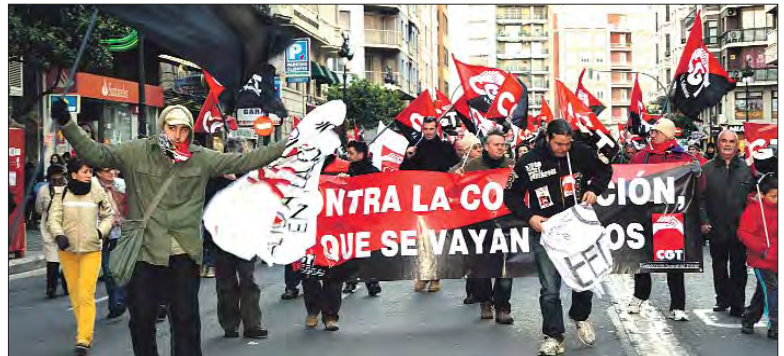
Valencia: Varias columnas recorren el centro de la ciudad.

Gabinete de Prensa Confederado de la CGT