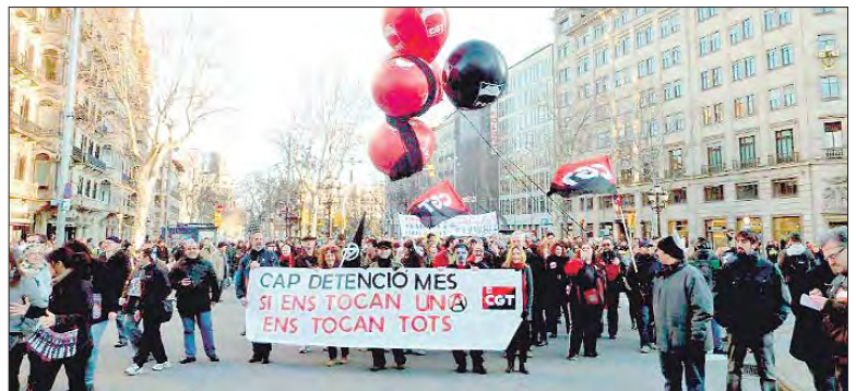
Columna antirrepresiva, una de las varias que se manifestaron en Barcelona.