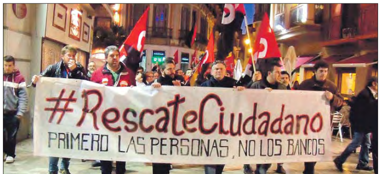
Málaga por las personas, contra los bancos.