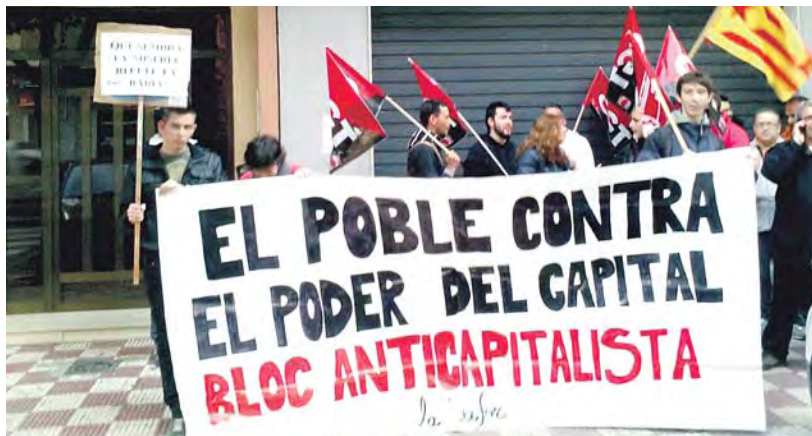
El Bloque Anticapitalista de la Safor, concentrado ante la empresa de trabajo temporal IMAN-TEMPORING, para denunciar las condiciones laborales a las que estas empresas someten a los y las trabajadoras de nuestra comarca. CGT- LA SAFOR