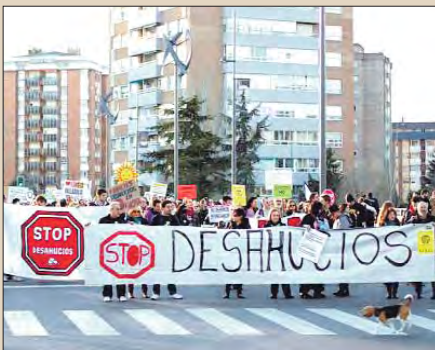
Valladolid se moviliza contra los desahucios.

Entre dos y tres mil personas han respondido a este llamamiento en Valladolid iniciando una marcha que ha recorrido el centro de la ciudad, entre consignas como "Mariano, Mariano, no llegas al verano", "Dimitir no es un nombre ruso", o "No son suicidios, son asesinatos", exigiendo el fin del drama de los desahucios y la aprobación de la Iniciativa Legislativa Popular que reclama una moratoria inmediata de desahucios para primera vivienda e insolvencia sobrevenida, la dación en pago y el alquiler social.