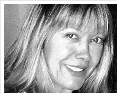
Purificación Eisman Comunicació

"El repte més important és aconseguir que tots els afiliats es senten representats per aquest SP majoritàriament format per dones, fer que participen activament en aquests moments tan complicats, donar suport en aquelles seccions sindicals que ho necessiten i formar a companys perquè siguen autosuficients a l'hora de saber defensar els seus drets i els dels companys. I també estar on ens requereixen en temes d'acció sindical, i continuar treballant al carrer fent-nos més visibles (manifestacions, desnonaments, acomiadaments, vagues, etc.) perquè la base d'aquest sindicat és el suport mutu i la solidaritat. Espere que la responsabilitat no em pese massa i pugui aprendre de la mà dels meus companys i fer el millor possible el meu treball. Pense que hem format un bon equip."