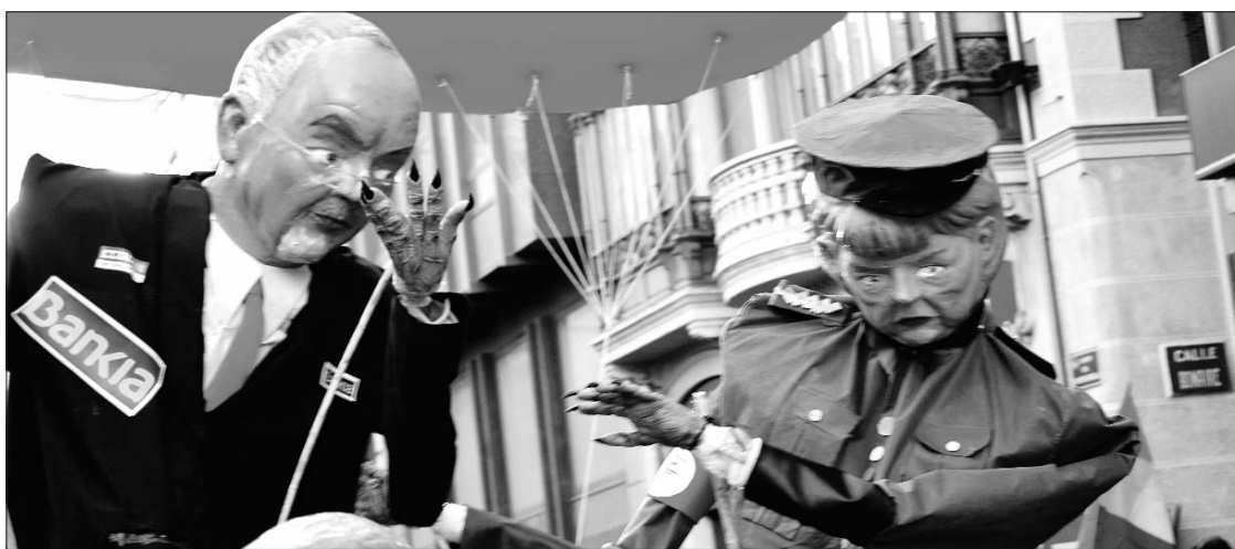
Manifestació a València en la jornada de Vaga General de l'Ensenyament Públic contra la reforma educativa de Wert, 9 maig 2013.

Tornant a l'espai de l'educació pública, el decret Wert que va regular els ensenyaments