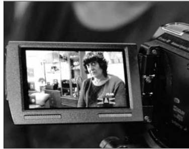
Moment de la filmació per al documental del testimoni de Paqui, germana de Valentín.