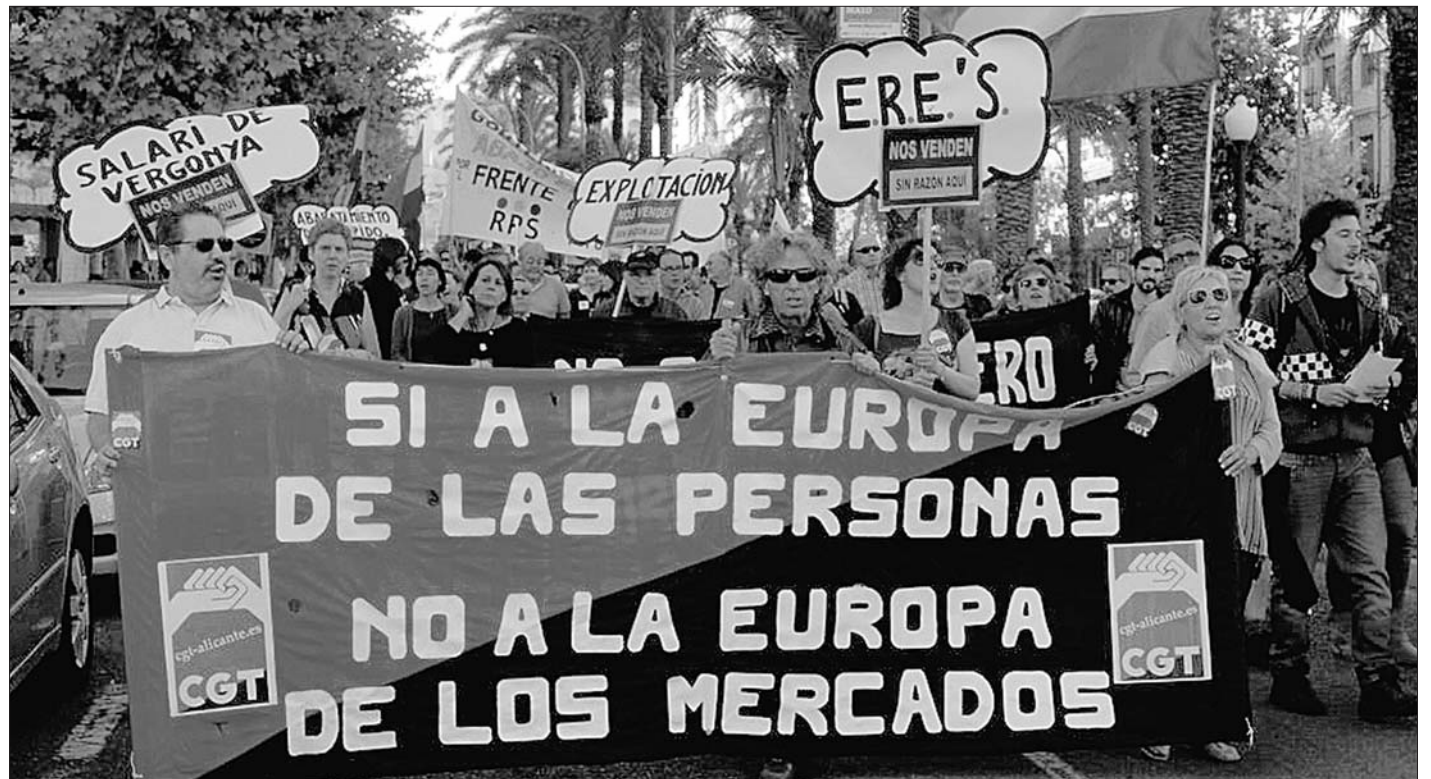
Manifestació Pobles Units contra la Troika a Alacant, 1 juny 2013.

Avgda. del Cid 154 baix Tels. 96 383 44 40 46014-València (València-L'Horta)