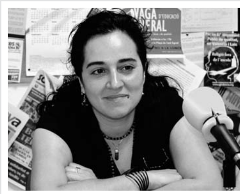
Mar Aguilar Jurídica

59 anys. Metal·lúrgic, amb més de 36 anys de treball en Ford-Almussafes. Militant anarcosindicalista i del moviment llibertari des de 1977