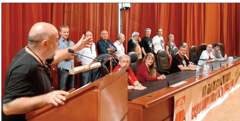
Apertura del Congreso