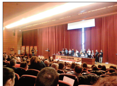
Apertura del Congreso