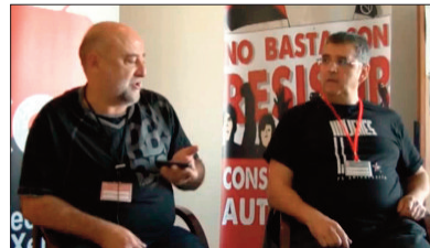
Rueda de Prensa