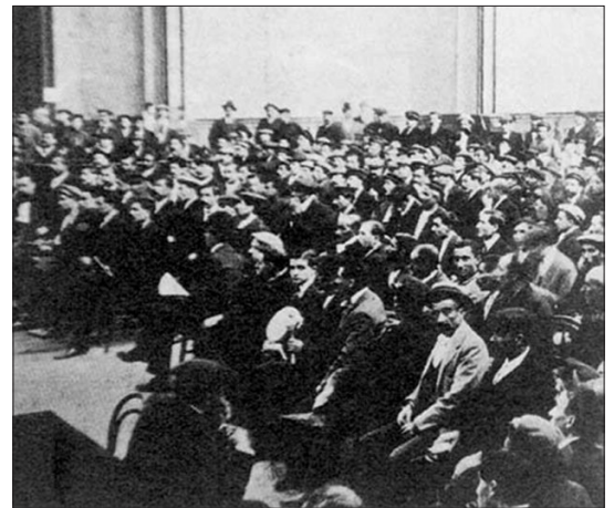
Teatro Bellas Artes de Barcelona. Noviembre de 1910. Segundo Congreso de Solidaridad Obrera y fundacional de la CNT

A finales de 1917 se crea la Federación Obrera Regional Andaluza (FORA), que cubriría las