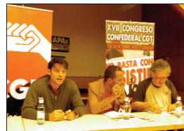
Charla de Sidi Bouzid