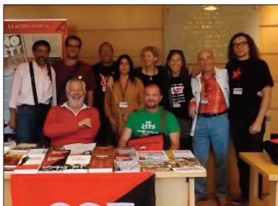
Vestíbulo del Paraninfo de la Universidad