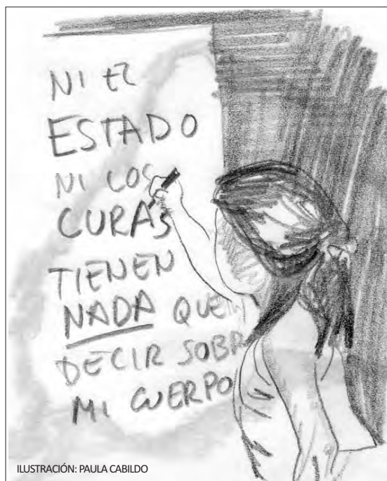
ILUSTRACIÓN: PAULA CABILDO

EDITA: Secretaría de Comunicación de CGT (sp-comunicacion@cgt.es)