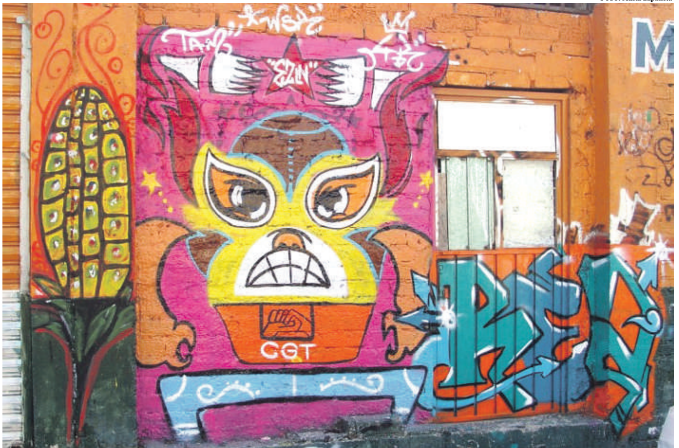
FOTO: Mural Zapatista